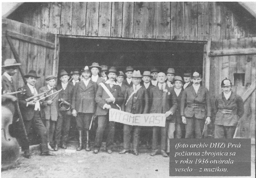
Prvá požiarna zbrojnica sa v roku 1936 otvárala veselo – z muzikou.

Našich oslávencov prišli pozdraviť ich kolegovia z celého okolia – z Brusna, Nemeckej, Hiadľa a do tanca aj do nálady hrala dychová hudba zo Slovenskej Lupče. Horšie to už bolo z počasím, ktoré sa tiež zahrlo na hasiča a po obede lejak hostí rozohnal. Zišli sa opäť večer na hasičskom bále, zatiaľ síce